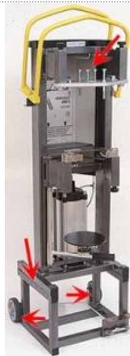
Vue de'ensamble de Hercules 2000S avec tous les accessoires assemblés.